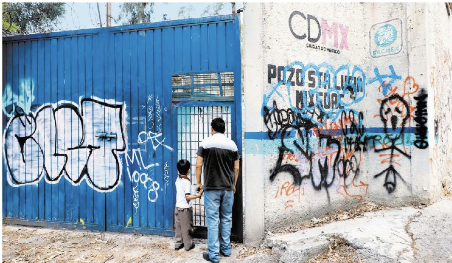
La dependencia firmó contratos por 152 millones de pesos con diversas empresas para alcanzar 18 venas de agua. JAVIER RÍOS