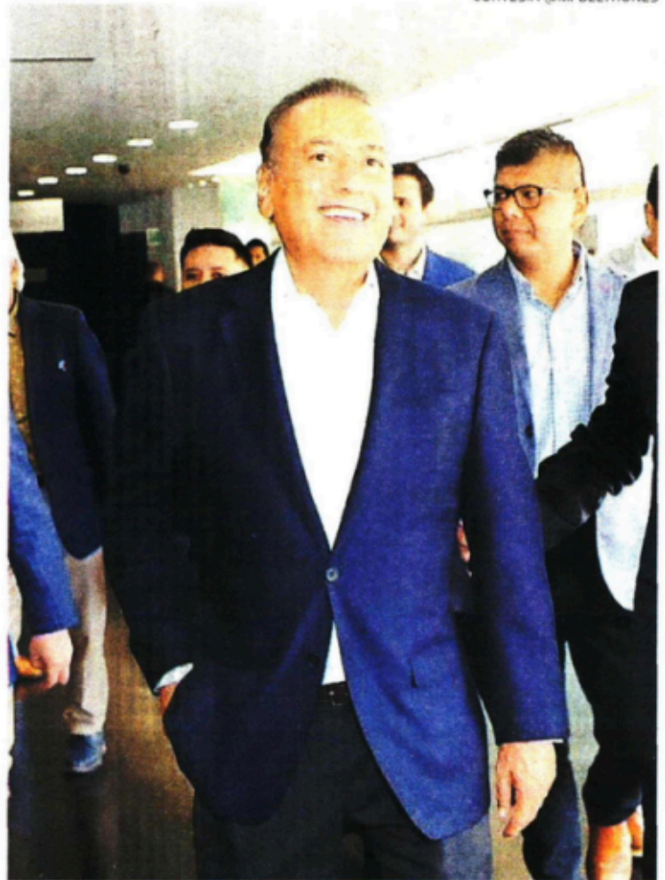
Manlio Fabio Beltrones ayer, al llegar al Senado

Dice que Alejandro Moreno lo calumnió, “pero este momento ya ha sido transitado y hoy estamos viendo cómo se instala la Cámara de Senadores”