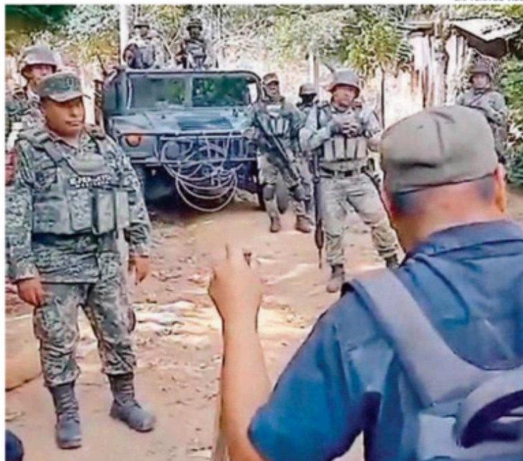
Pobladores impiden a elementos del Ejército pasar a sus comunidades