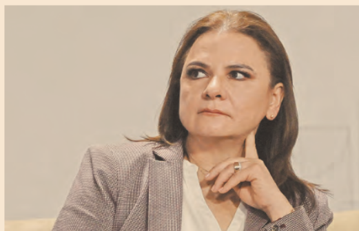
La comisionada aseguró que lo que se busca en el Inai es un diálogo abierto con la próxima administración.

Arturo Rojas arturo.rojas@eleconomista.mx