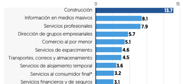
*Generación, transmisión, distribución y comercialización de energía eléctrica, suministro de agua y de gas natural

■ PIB acumulado en 2023, en por ciento anual