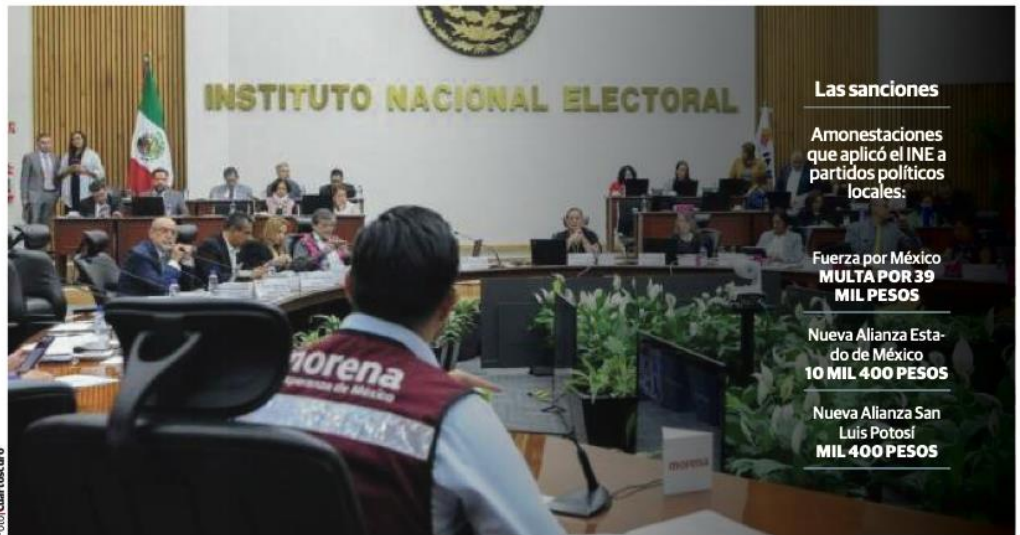
INTEGRANTES del Instituto Nacional Electoral durante una sesión ordinaria realizada el pasado mes de octubre.

2 De junio del próximo año serán las elecciones presidenciales