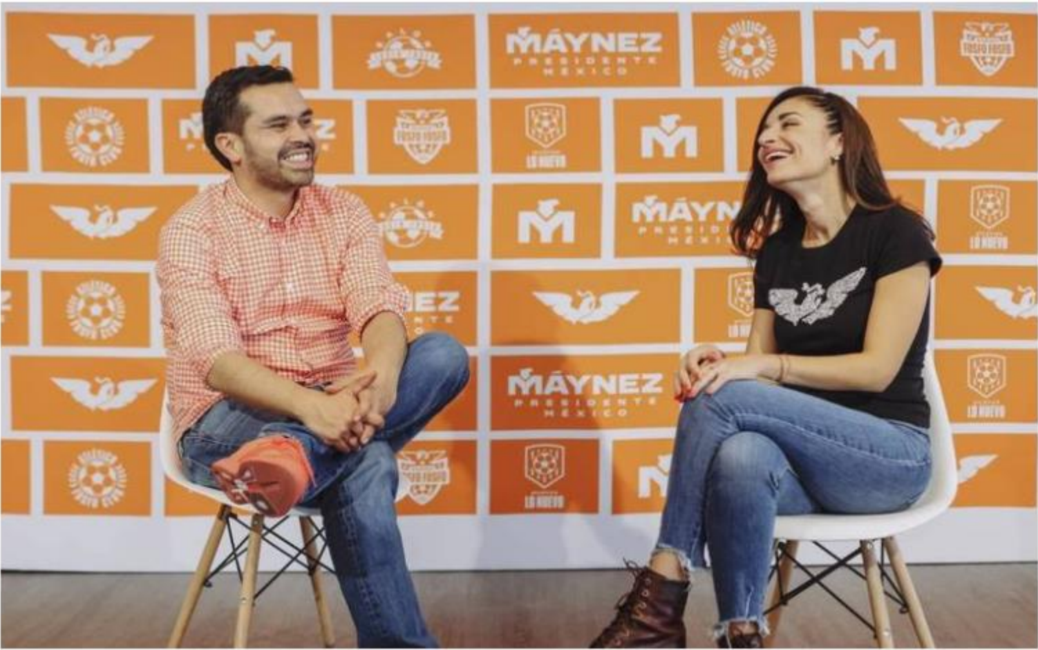
Jorge Álvarez Máynez y Laura Ballesteros.