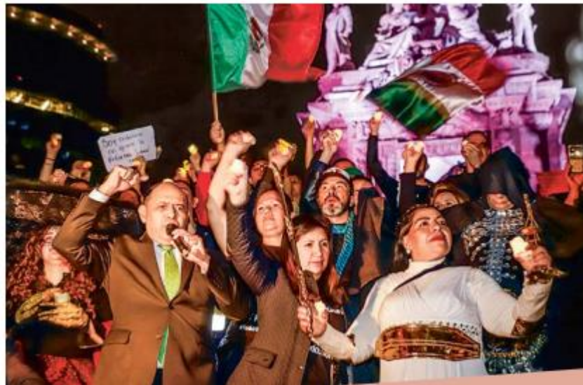
UNIDOS. Cientos de trabajadores del PJ alzaron la voz y señalaron que el paro de labores continuará.

Hasta el cierre de esta edición continuaba la presentación de las 330 reservas que presentaron todos los grupos parlamentarios.