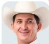
José Sabino Herrera Dagdug Senador electo del PRD