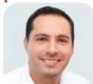
Mauricio Vila Dosal Senador electo del PAN