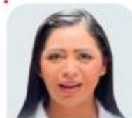
Araceli Saucedo Reyes Senadora electa del PRD