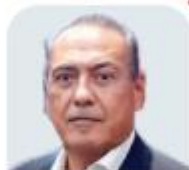
Manlio Fabio Beltrones Senador electo del PRI