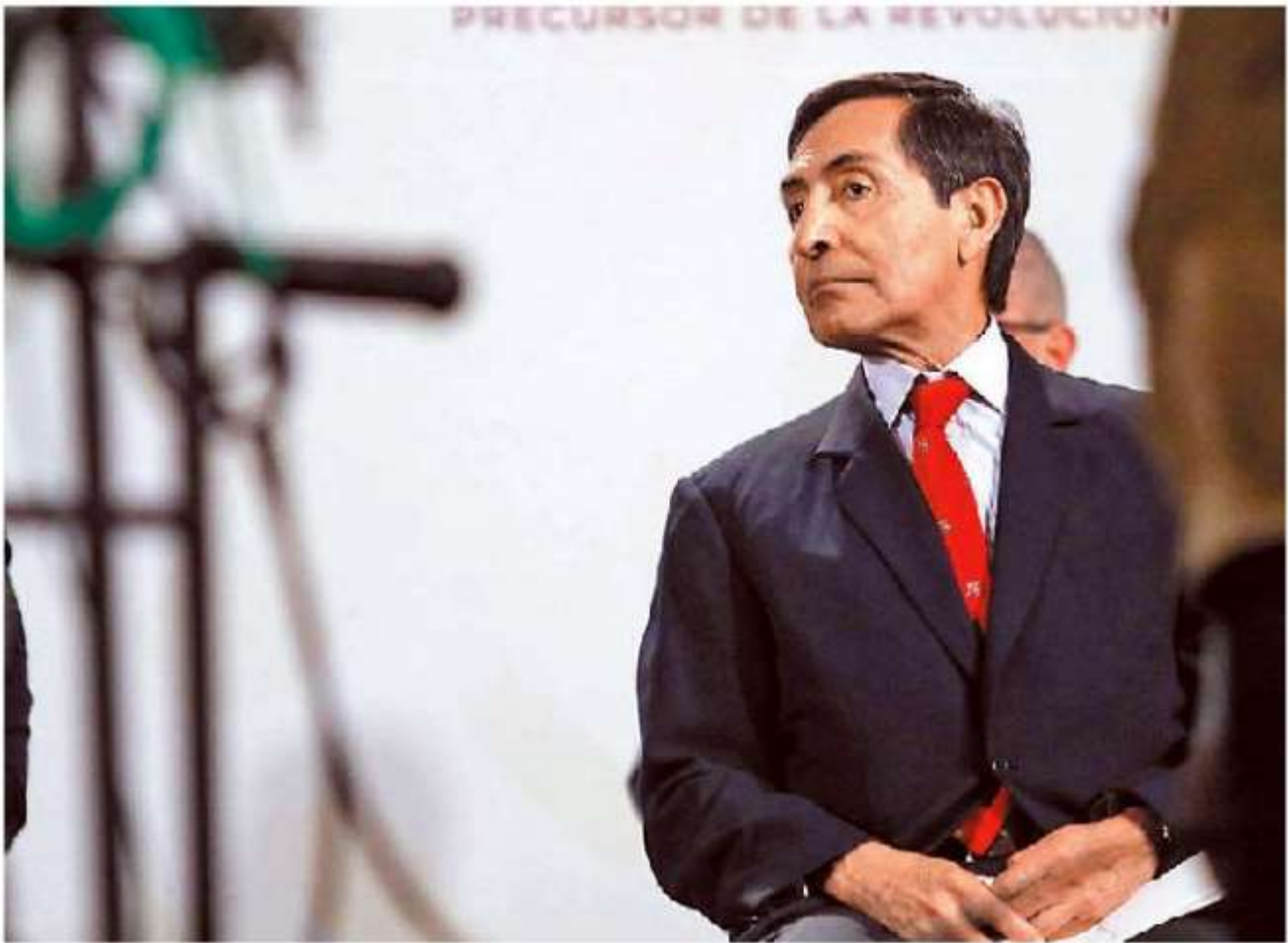
Espera una reducción en el valor del petróleo.