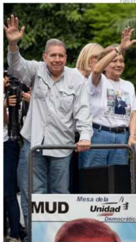
Edmundo González se ha ganado hasta la simpatía y apoyo de chavistas.

El candidato presidencial de oposición, el diplomático Edmundo González Urrutia, no solo ha transmitido confianza a los venezolanos de que se van a recobrar las cosas que el chavismo ha echado a la basura con discursos populista que no ha logrado cumplir