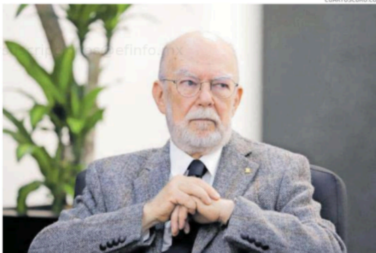
El ministro Juan Luis González Alcántara Carrancá, presenta una contrapropuesta a la reforma.

Asimismo, se propone invalidar la elección popular de jueces de distrito y