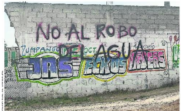
Los vecinos del municipio de Zumpango, Estado de México, se muestran inconformes con la decisión de llevarse el agua a la Ciudad de México.