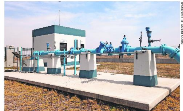
En la zona del Aeropuerto Internacional Felipe Ángeles (AIFA) existen ocho pozos ya terminados que pertenecen a la propia terminal aérea.

Agrega que en una visita que realizaron el 15 de diciembre de 2023 contaron ocho pozos. “Estamos haciendo un mapeo y ya estaban perforando otro”, asegura. ●