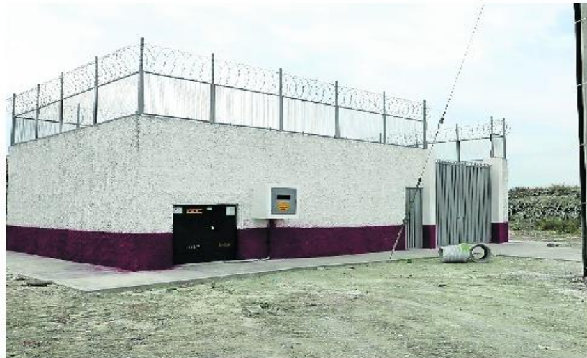
Algunos pozos se encuentran ubicados a la orilla del Gran Canal, por lo que los vecinos temen que se contaminen con aguas negras.

ya terminados se ubican en la zona del Aeropuerto Internacional Felipe Ángeles (AIFA).