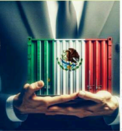
Ilustración: IA Grupo REFORMA