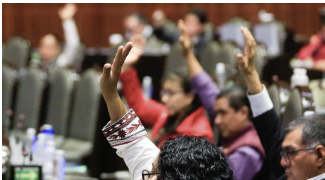
Votación en San Lázaro.

“Imagínense lo de ayer: el presidente del PAN presenta una solicitud para que intervenga la SCJN y le