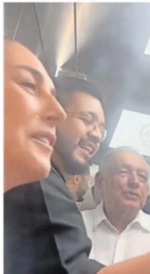
FOTOS TOMADAS DE VIDEO

Un par de horas más tarde, mientras el jefe del Ejecutivo federal informaba la entrega de proyectos prioritarios