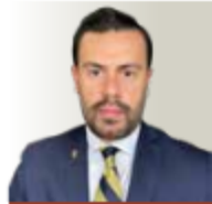
POR ELLIOT VELHER