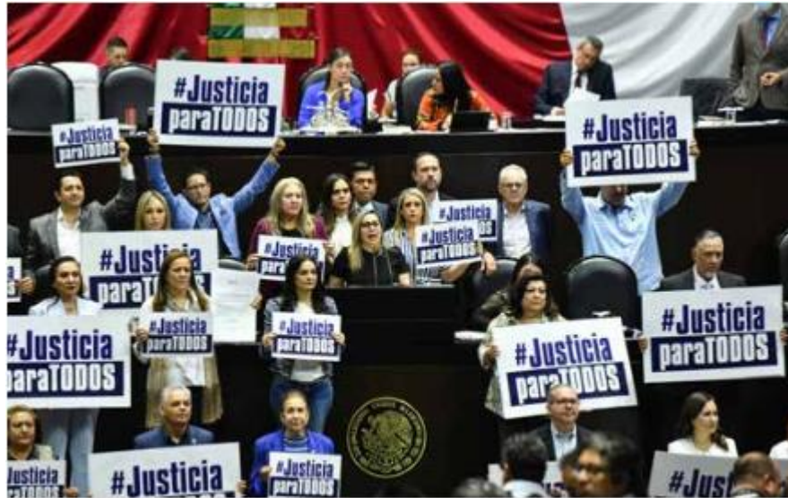
Grupo parlamentario del PAN se manifiesta en contra de la Ley de Amnistía.