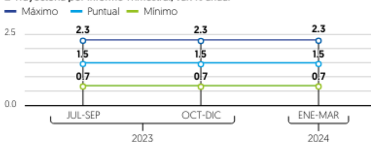
Trayectoria por Informe Trimestral, var. % anual