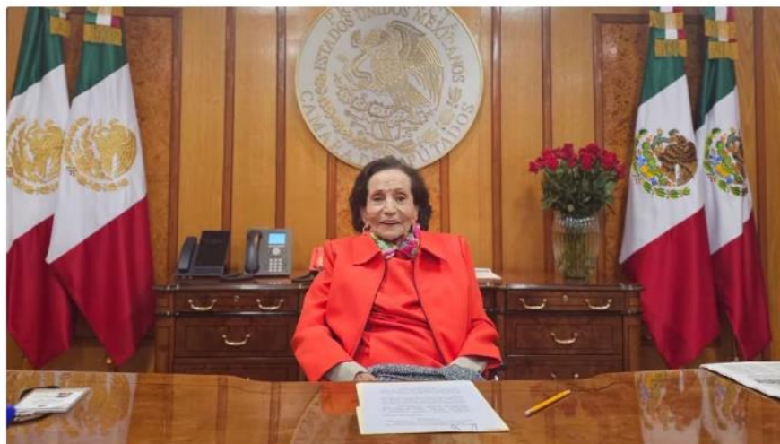
Ifigenia Martínez fundó el PRD.

La política mexicana es una de las pioneras de izquierda, ya que fundó uno de los partidos más representativos del país, pese a que a la fecha perdió su registro. Se trata del Partido de la Revolución Democrática ( PRD ), que fue inaugurado por ella y Cuauhtémoc Cárdenas en 1989.