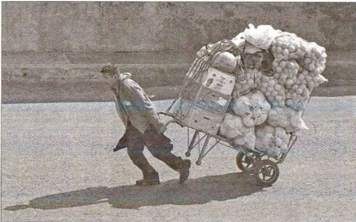
▲ Los salarios de los trabajadores representan 26 por ciento del PIB.