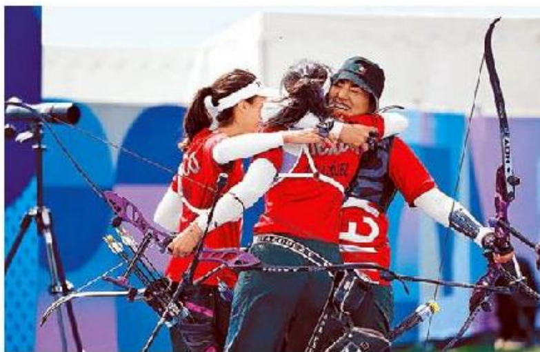
El tiro con arco ya dio una medalla en París.

Durante la era de Ana Guevara también han sido castigadas presupuestalmente las federacio-