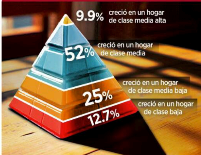
Ilustración: IA Grupo REFORMA

Origen y trayectoria de los impartidores de justicia federales: