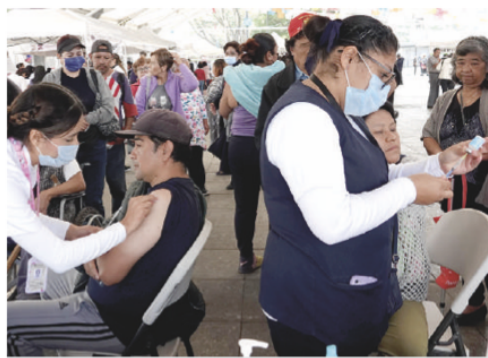
LA SSA reportó esta semana que el avance en la vacunación contra el Covid-19 tiene un avance de apenas 28%, contra 76% en la aplicación del biológico contra influenza, con 26 millones de dosis aplicadas.

SEGÚN reporte de Hacienda, sólo se ejecutó 105 mil de 209 mil mdp programados; en biológicos se emplearon 2,951 de 4,935 mdp; ello, pese a baja cobertura en inmunización