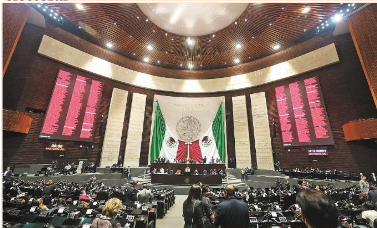
Pleno de la Cámara de Diputados.