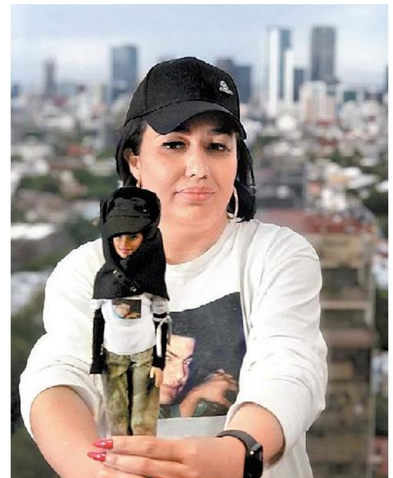
La abogada muestra su versión de la famosa muñeca.

En 10 años han recuperado restos de 43 personas en Reynosa y 365 más en Miguel Alemán