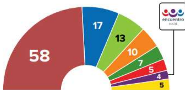
Con esta repartición de escaños se encuentra.