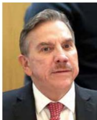
Javier Laynez Potisek, ministro de la Suprema Corte.