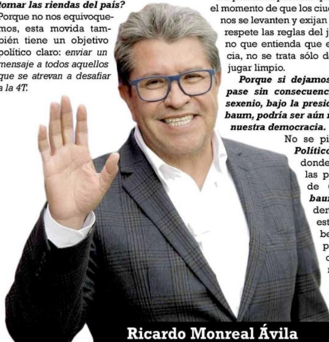
Ricardo Monreal Ávila

Porque no nos equivoquemos, esta movida también tiene un objetivo político claro: enviar un mensaje a todos aquellos que se atreven a desafiar a la 4T.