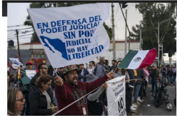
side/Coex | Manifestantes bloquean las entradas al Congreso en contra de la propuesta de reforma constitucional que haría que los jueces se presentaran a elecciones en la Ciudad de México el martes 3 de septiembre de 2024. (AP Photo/John Marquez)