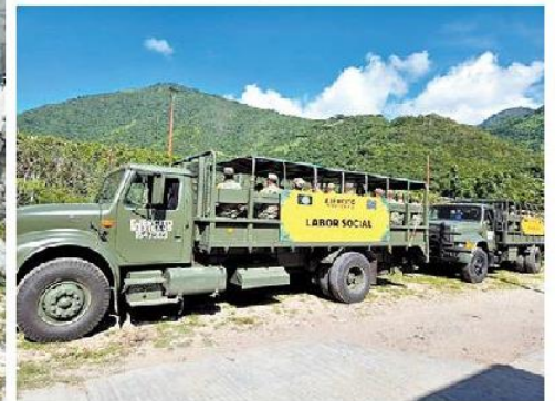
Efectivos de la Sedena, en coordinación con sus pares de Guatemala, realizan patrullajes motorizados y a pie.