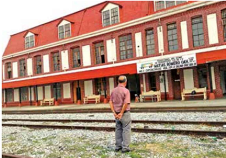
Fachada de la estación de ferrocarril de Matías Romero, en la actualidad. Los exferrocarrileros esperan una jubilación justa.