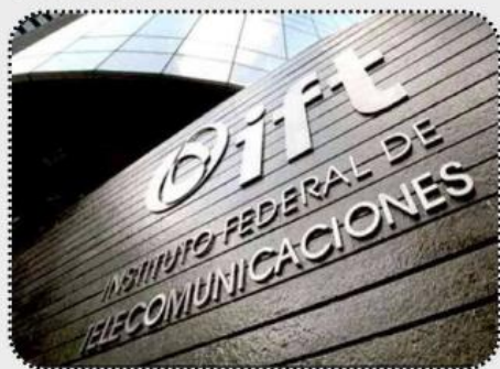
Instituto Federal de Telecomunicaciones