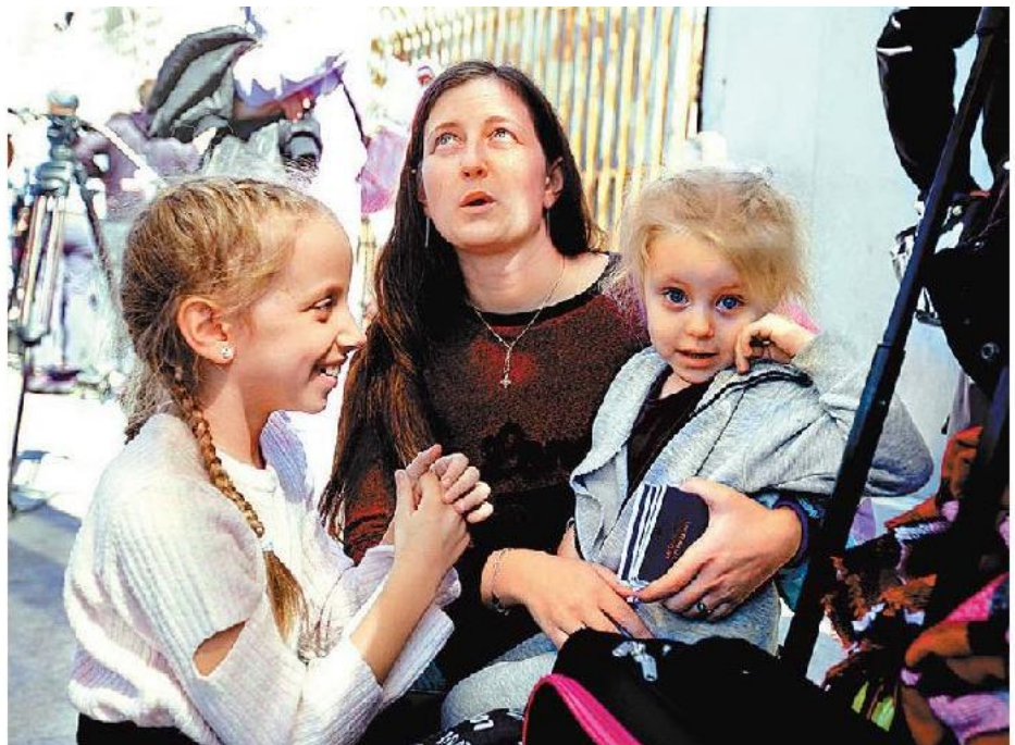
Familia del país atacado en su estancia en Tijuana. JAVIERRÍOS

• FUENTE: INM • INFORMACIÓN: Rafael López • GRÁFICO: Juan Carlos Fleicer