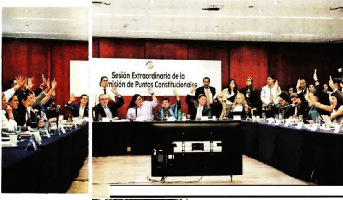
Legisladores en sesión y cerco policiaco en el Senado ante protestas, que seguían anoche. J.C. BAUTISTA