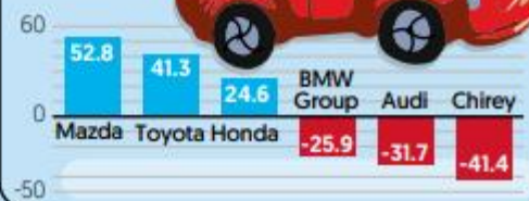
■ % Var anual, venta autos en agosto

Para el octavo mes del año, Mazda presentó el mayor crecimiento en ventas, mientras Chirey se llevo la mayor caída.