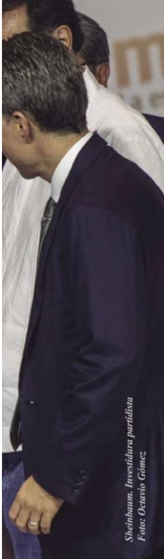
Sheinbaum. Invidiatura paratista

L a estructura que operó en favor de Claudia Sheinbaum Pardo para ganar las encuestas internas de Morena –y que incluyó a secretarios de Estado, senadores, diputados federales y locales, gobernadores, presidentes municipales y grupos corporativos, todos alineados en la “cargada” liderada por AMLO–, es ahora la principal arma de la exjefa de Gobierno de la Ciudad de México para enfrentar a Xóchitl Gálvez, virtual candidata de la oposición rumbo a las elecciones del 2 de junio de 2024.