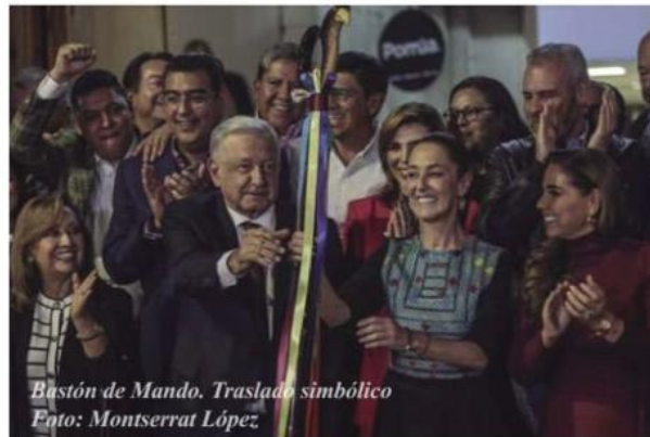
Bastón de Mando. Traslado simbólico Foto: Montserrat López.

Así, con toda esa cargada de respaldo, Claudia Sheinbaum se preparaba para iniciar el domingo 17 una nueva gira por las 32 entidades para convocar al “Acuerdo por la Unidad” del movimiento rumbo a las elecciones presidenciales de 2024.