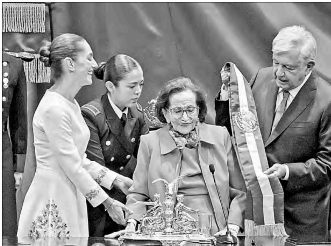
► Su último acto público fue durante la ceremonia de transmisión de poderes el martes pasado; en ese momento se le oyó decir: “Híjole, apenas me sostengo”.

en San Lázaro, Noemí Luna, señaló en esa red social: “Mi más sentido pésame a nombre de los diputados del PAN a familiares y seres queridos de la presidenta del Congreso de la Unión, la diputada Ifigenia Martínez. Mujer de izquierda, defensora de derechos humanos y pionera en la lucha feminista. Su legado perdurará por siempre”.