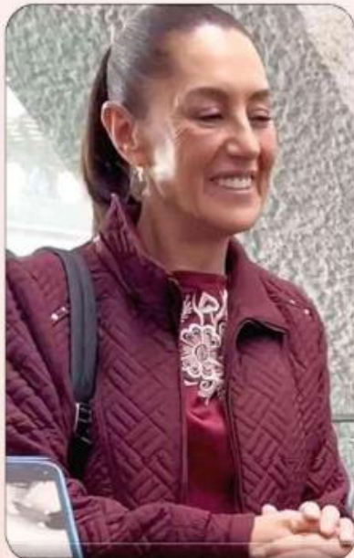
Claudia Sheinbaum Pardo