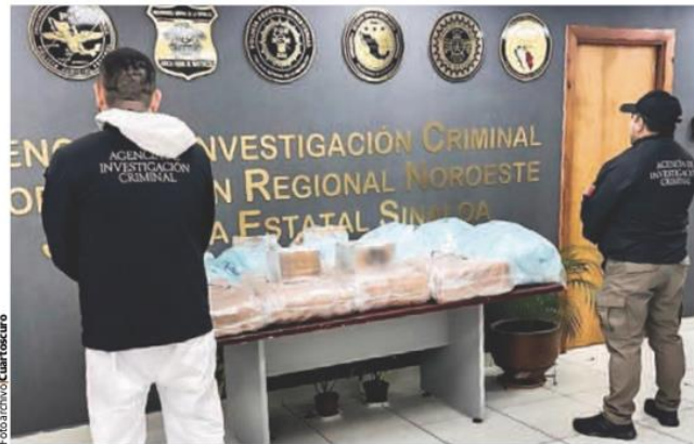
AUTORIDADES posan frente a un decomiso de droga en Sinaloa, en febrero pasado.

DATOS DEL SESNSP muestran que la Fiscalía local registró el año pasado 40 investigaciones de esta modalidad de delito contra la salud; transporte y posesión de sustancias, al alza