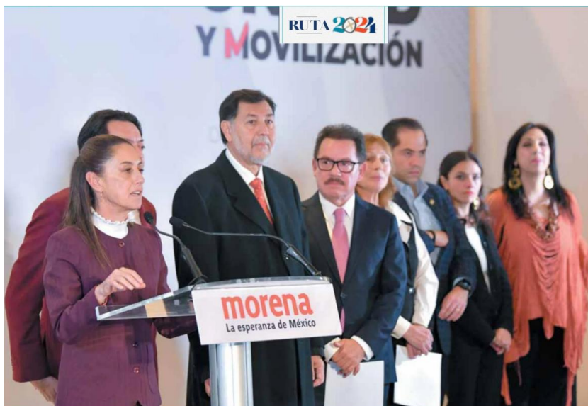
RESPALDO | • La candidata presidencial de Morena, Claudia Sheinbaum, acompañada de su equipo de campaña, respaldó el paquete de reformas del Presidente.