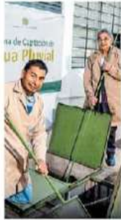
Contamos con 8 sistemas para la captación de agua pluvial