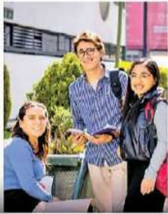
Nuevamente, somos la mejor Universidad Pública Estatal (THE Latin America University Rankings)