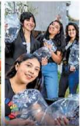
Acopiamos 119 mil kilogramos de envases de PET para su reciclaje