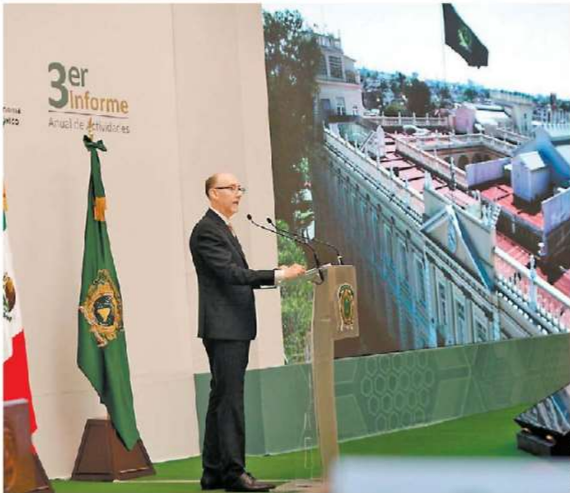
-Transparencia. El rector presentó el tercer informe anual de actividades de la administración 2021-2025.