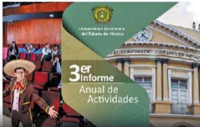
430 funciones de teatro, con 16 mil asistentes