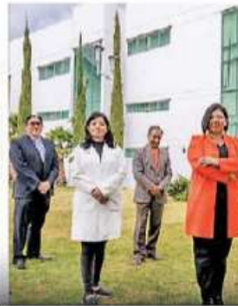
821 integrantes del Sistema Nacional de Investigadoras e Investigadores