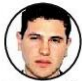
Iván Archivaldo Guzmán 10 mdd