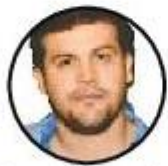
Joaquín Guzmán López 5 mdd