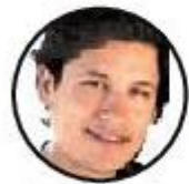
Jesús Alfredo Guzmán Salazar 10 mdd