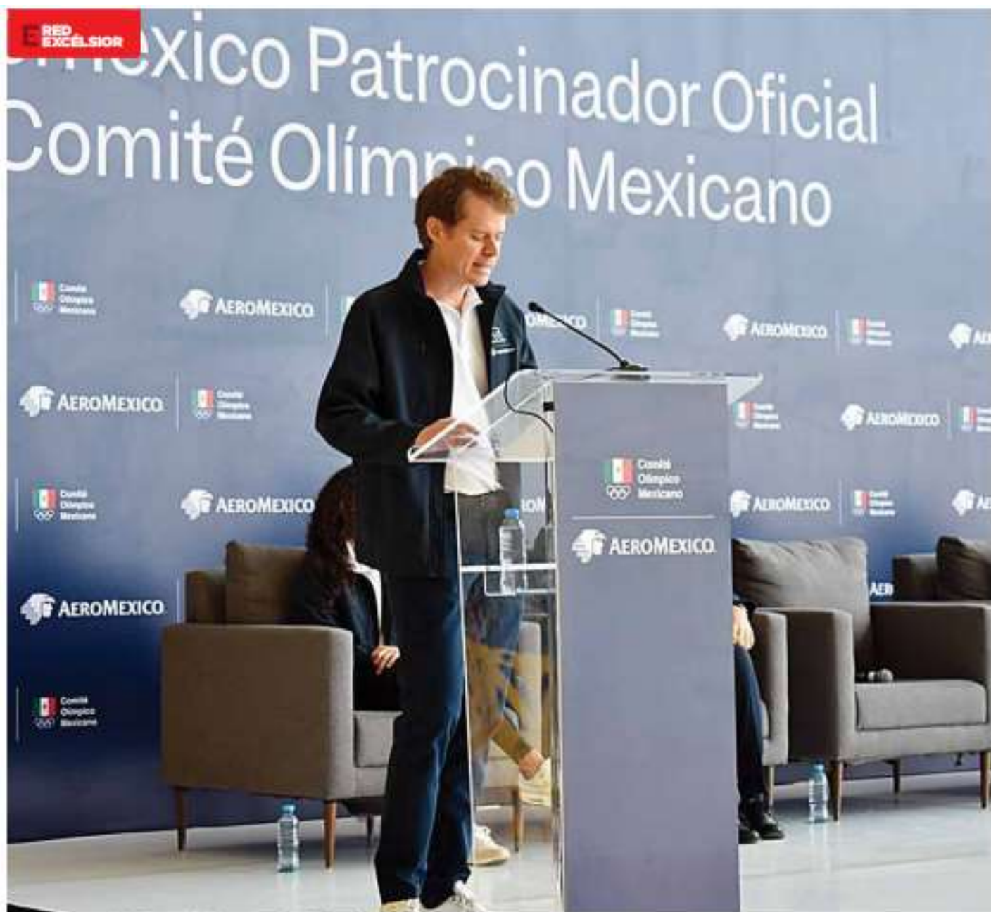
La aerolínea reconocerá a los atletas galardonados con un vuelo redondo en Cabina Premier.