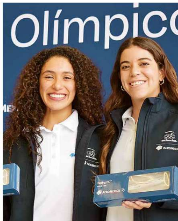
Antes, durante los Juegos Olímpicos de México 1968, Aeroméxico ya había sido la línea aérea oficial de la justa deportiva.