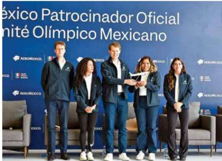
Aeroméxico se ha distinguido por apoyar al deporte nacional, entre muchos otros ámbitos, como la cultura y la educación.