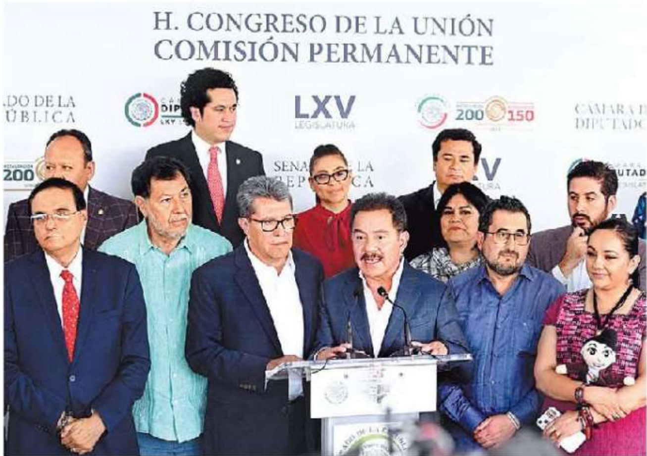
Los legisladores quieren votarlas en septiembre.