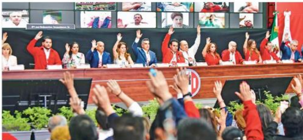
CÓNCLAVE. El tricolor celebró ayer, de manera semipresencial, su Consejo Político Nacional.

metodología para la renovación de dirigencias y estructuras, así como construir una nueva propuesta para enfrentar la “grave” situación que vive el país.