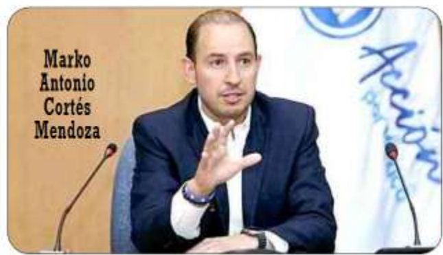
Marko Antonio Cortés Mendoza