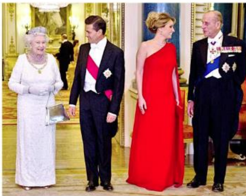
■ Enrique Peña, último Presidente pirista, y Angélica Rivera con los Reyes de Inglaterra.