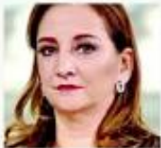
Claudia Ruiz Massieu