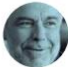
ALFONSO RAMÍREZ CUÉLLAR

› La ex presidenta de Argentina, Cristina Fernández de Kirchner , se dio una vuelta, la tarde de ayer, por la casa de transición de la presidenta electa, Claudia Sheinbaum , quien la recibió en sus oficinas. Antes, la sudamericana había visitado a la jefa de Gobierno electa, Clara Brugada . A ambas les deseó hacer realidad la utopía de Simón Bolívar.