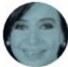
CRISTINA FERNÁNDEZ DE KIRCHNER

› Hablando de la presidenta de la Corte, Norma Piña , resulta que el ex ministro Arturo Zaldívar le echó en cara que "sin mí, no hubiera sido ministra". No sólo eso, sino que el próximo Coordinador de Política y Gobierno de la Presidencia reveló que eran "buenos amigos" y "yo la ayudé muchísimo, cosa que ya se le olvidó". Así.