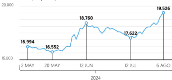
Dólar interbancario ■ Cierre diario, en pesos por divisa

El reciente periodo de volatilidad que afecta al peso, podría presionar los precios de algunos alimentos en el corto plazo; México depende de las importaciones de maíz, carne de cerdo y trigo para cubrir el déficit de la producción nacional.