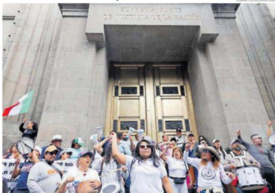
Trabajadores del Poder Judicial insisten en frenar la reforma.

Así, rechazaron el pleno de la Suprema Corte determinó no avalar los proyectos de las ministras Yasmín Esquivel